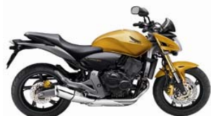
CB 600 F HORNET

Proposta Unificada - Nova Legislação Consórcio