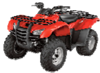
TRX 420 TM