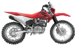
CRF 230 F