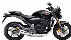
CB 600F HORNET ABS