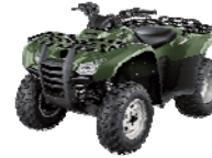
TRX 420 FM